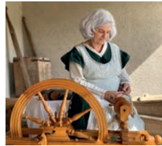
النسيج مع الجدة