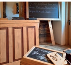
المدرسة كما كانت على أيام هايدي