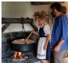
صنع الجبنة مع العم البوهي