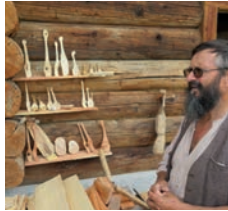
نحت الخشب مع العم البوهي