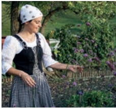
تجربة هايدي للبحث عن الأعشاب