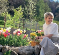
جولة إرشادية في قرية هايدي

استكشفوا موطن هايدي في الجبال من خلال جولة إرشادية ممتعة. عيشوا تجربة ارتياد حصة مدرسية كما كانت تفعل هايدي، أو انحتوا من الخشب ملعقة خاصة بكم مع العم البوهي. ستتعرفون في تجربة البحث عن الأعشاب على أعشاب طبية، وستصنعون مرهمًا خاصًا بكم. هناك الكثير لتروه وتتعلموه في القرية.