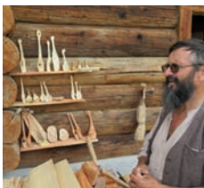
SCHNITZEN MIT ALPÖHI