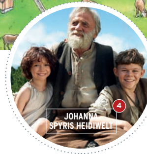
JOHANNA SPYRIS HEIDIWELT