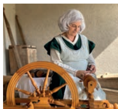
SPINNEN MIT DER GROSSMUTTER